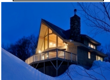
アンヌプリビレッジ ASH

さらに北海道が誇る歴史的建造物、余市ニッカウキスキー工場内の旧事務所、竹鶴邸、リタハウスも見学します。蔵出しウイスキーの試飲（無料）もお楽しみに！