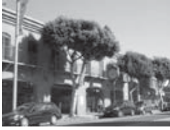
ドイツ バウハウス

と思います。そこと実際の日本人としての思い、気持ちというのがうまく噛み合わないまま行ってしまっているところが歪みのひとつかなと思っていますね。