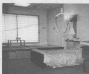
水平トランスファー・ギャッジベッド

るいは来客用のコーナーとして使用。ゆったりとした安らぎの持てる寝室を提案している。各室内のインテリアも明るいベースカラーを基調とし、暖かい手触りの木や布地・紙等を採用。全体的に落ち着いた雰囲気統一している。当日は35名程の参加があり、様々な工夫と配慮を凝らした設備機器や介助器具の使用について、説明を受けたり実際に動かしてみたり、非常に熱心に見学しているのが印象的であった。