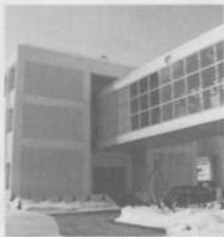
札幌高等専門学校