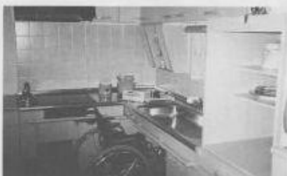
フレキシブルキッチンユニット

千代田生命新札幌ビル1階に、平成3年10月オープンした高齢者・障害者配慮住宅ショールーム【ラプリーライフ】にて昨年12月17日2回目の見学会が開催された。展示部分は123.57㎡、その中を生涯・重度と2つのゾーンに分けて提案。生涯ゾーンは軽度の障害により車イスを使用している方が、家族と共に快適に暮らして行ける工夫を折りこんだ日常生活復帰への提案であり、重度ゾーンは全介助の場合を例としている。寝室から浴室まで水平に移動できるトランスファーや高さを調節できるギャッジベッドを導入。南面に3畳程の小上りを設け家事や趣味あ